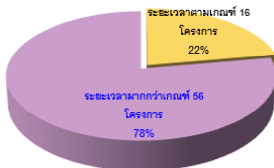
แผนภูมิ : แสดงระยะเวลาการบริหารโครงการภาพรวม

จากข้อมูลการเปรียบเทียบระยะเวลากระบวนการดำเนินงานของโครงการ ฯ พบว่า โครงการ ฯ ที่ใช้ระยะเวลาตามเกณฑ์ มีจำนวนน้อย ซึ่งส่วนใหญ่ใช้ระยะเวลามากกว่าเกณฑ์เกือบร้อยละ 78 ถ้าเปรียบเทียบจากโครงการทั้งหมด ทำให้การบริหารโครงการที่ยังไม่มีประสิทธิภาพเท่าที่ควร ดังนั้น ในการบริหารโครงการทางส่วนกลางจึงเกิดข้อเสนอต่อการบริหารโครงการ ฯ ว่า ควรออกแบบและวางแผนการเบิกจ่ายงบประมาณโครงการ ฯ ในงวดแรกให้มีจำนวนโครงการ ฯ ที่มีระยะเวลาการบริหารโครงการให้เป็นตามเกณฑ์ ร้อยละ 70 ของจำนวนโครงการ ทั้งหมด เพื่อให้การเบิกจ่ายงบประมาณในงวดที่สองไม่เกิดความล่าช้าจนเกินไป โดยยังคงอยู่ในช่วงระยะเวลาตามมาตรฐานของการบริหารโครงการ หรือเร็วกว่ามาตรฐาน