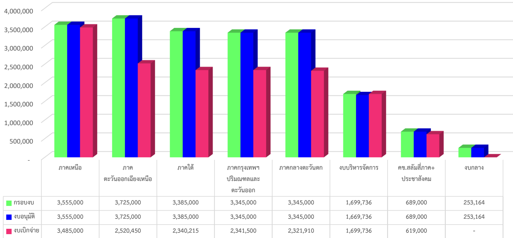
งบประมาณ และอนุมัติเบิกจ่ายโครงการพัฒนาคุณภาพชีวิตผู้มีรายได้น้อยในเมืองและชนบท ปี 2568 ประจำเดือนมิถุนายน 2568