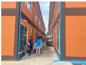
ชุมชนร่วมไทรงามพัฒนา ก่อสร้างเสร็จ 28 ครั้วเรือน ระหว่างสร้าง 160 ครั้วเรือน