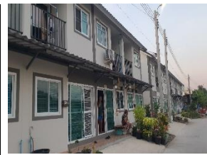
ชุมชนคลองเปรมประชาพัฒนา ก่อสร้างเสร็จ 93 ครั้วเรือน ระหว่างสร้าง 61 ครั้วเรือน และเตรียมพื้นที่ก่อสร้าง 40 ครั้วเรือน