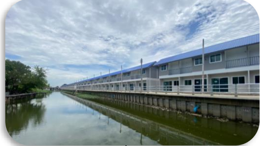
สหกรณ์เคหสถานบ้านมั่นคงชุมชนวัดรังสิต จำกัด