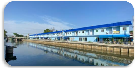
สหกรณ์เคหสถานชุมชนประชาร่วมใจ 1 จำกัด

1 สร้างเสร็จ 616 ครัวเรือน ร้อยละ 9.65 ของครัวเรือนทั้งหมด