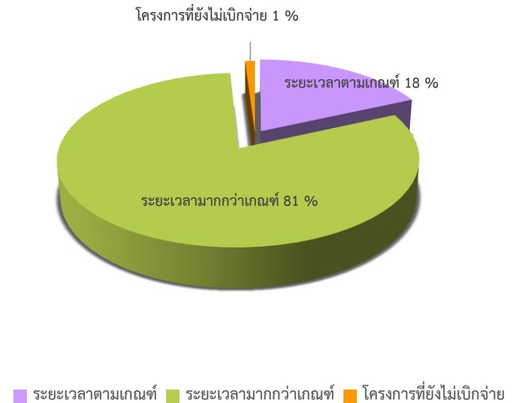
ระยะเวลาการบริหารโครงการภาพรวม

ขอให้สำนักงานภาค เร่งรัดการเบิกจ่ายงบประมาณ เพื่อให้ดำเนินการได้ตามมาตรฐาน พร้อมทั้งตรวจสอบปัญหาอุปสรรคที่ส่งผลกระทบต่อความล่าช้าในการเบิกจ่ายงบประมาณ เพื่อนำมาล่าช้า เพื่อนำมาวิเคราะห์แนวทางแก้ไขปัญหา และการออกแบบการบริหารโครงการให้มีประสิทธิภาพในอนาคต