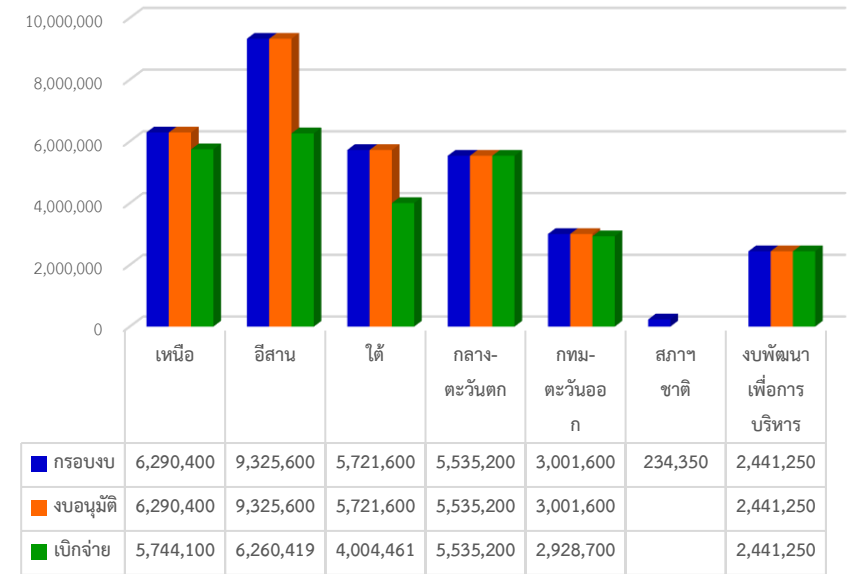
โครงการเสริมสร้างฯ ปี 2565 ณ กรกฎาคม 2565

3.2 สำนักงานภาคตะวันออกเฉียงเหนือ โครงการเสริมสร้างขีดความสามารถของชุมชนจังหวัดขอนแก่น จำนวน 350,471 บาท ขอให้จัดส่งบันทึกการอนุมัติยกเลิกโครงการ ให้กับสำนักยุทธศาสตร์นโยบายและแผน เพื่อเป็นข้อมูลในการจัดทำรายงานต่อไป