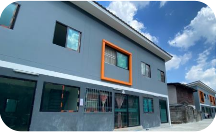
ชุมชนริมคลองบางซื่อรัชดา