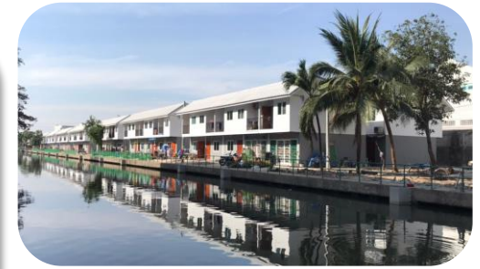
สหกรณ์เคหสถานประชาร่วมใจ 2 จำกัด

ณ สิ้นเดือนกรกฎาคม 2565 มีพื้นที่สามารถดำเนินการได้ 10 ชุมชน (8 โครงการ) 998 ครัวเรือน ร้อยละ 15.63 ของครัวเรือนทั้งหมด