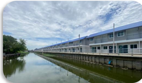
สหกรณ์เคหสถานบ้านมั่นคงชุมชนวัดรังสิต จำกัด