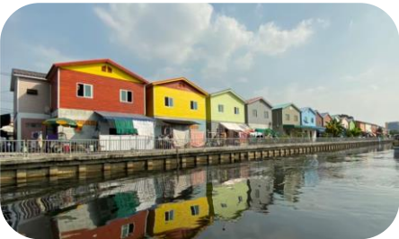
ชุมชนรุ่นใหม่พัฒนา

ณ สิ้นเดือนกรกฎาคม 2565 มีพื้นที่สามารถดำเนินการได้ 35 ชุมชน (41 โครงการ) 3,538 ครัวเรือน ร้อยละ 50.05 ของครัวเรือนทั้งหมด