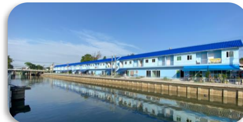
สหกรณ์เคหสถานชุมชนประชาร่วมใจ 1 จำกัด

1 สร้างเสร็จ 528 ครัวเรือน ร้อยละ 8.27 ของครัวเรือนทั้งหมด