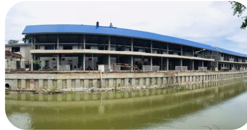
สหกรณ์เคหสถานบ้านมั่นคงชุมชนวัดรังสิต จำกัด