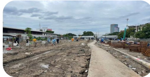
สหกรณ์เคหสถานชุมชนประชาร่วมใจ 1 จำกัด

1 สร้างเสร็จ 358 ครัวเรือน ร้อยละ 5.61 ของครัวเรือนทั้งหมด