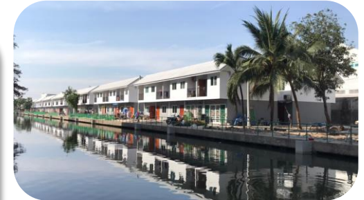
สหกรณ์เคหสถานประชาร่วมใจ 2 จำกัด

ณ สิ้นเดือนพฤษภาคม 2564 มีพื้นที่สามารถดำเนินการได้ 5 ชุมชน (3 โครงการ) 774 ครัวเรือน ร้อยละ 12.12 ของครัวเรือนทั้งหมด