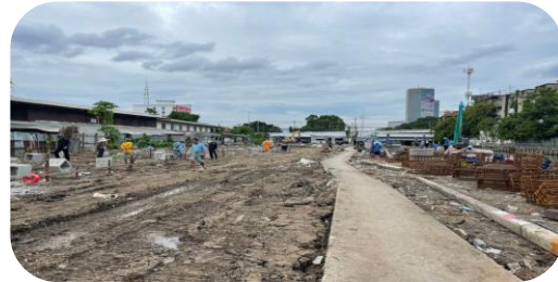
สหกรณ์เคหสถานชุมชนประชาร่วมใจ 1 จำกัด

1 สร้างเสร็จ 196 ครัวเรือน ร้อยละ 3.07 ของครัวเรือนทั้งหมด