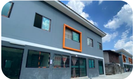
ชุมชนริมคลองบางซื่อรัชดา

ณ สิ้นเดือนพฤษภาคม 2564 มีพื้นที่สามารถดำเนินการได้ 35 ชุมชน (41 โครงการ) 3,536 ครัวเรือน ร้อยละ 50.02 ของครัวเรือนทั้งหมด