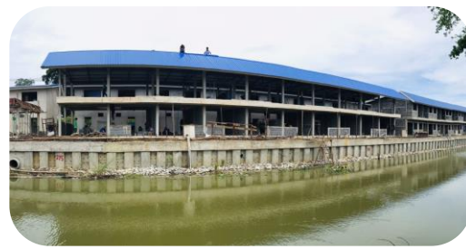
สหกรณ์เคหสถานบ้านมั่นคงชุมชนวัดรังสิต จำกัด