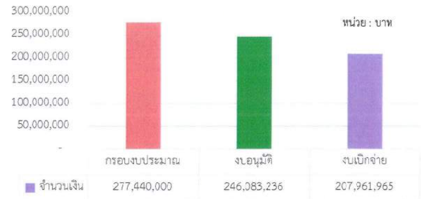
ภาพรวมการอนุมัติเบิกจ่ายงบประมาณโครงการสนับสนุนการจัดสวัสดิการชุมชน งบประมาณ 2564 ณ 1 เมษายน 2564

การอนุมัติเบิกจ่ายโครงการสนับสนุนการจัดสวัสดิการชุมชน ปี 2564 มีสถานะ ดังนี้