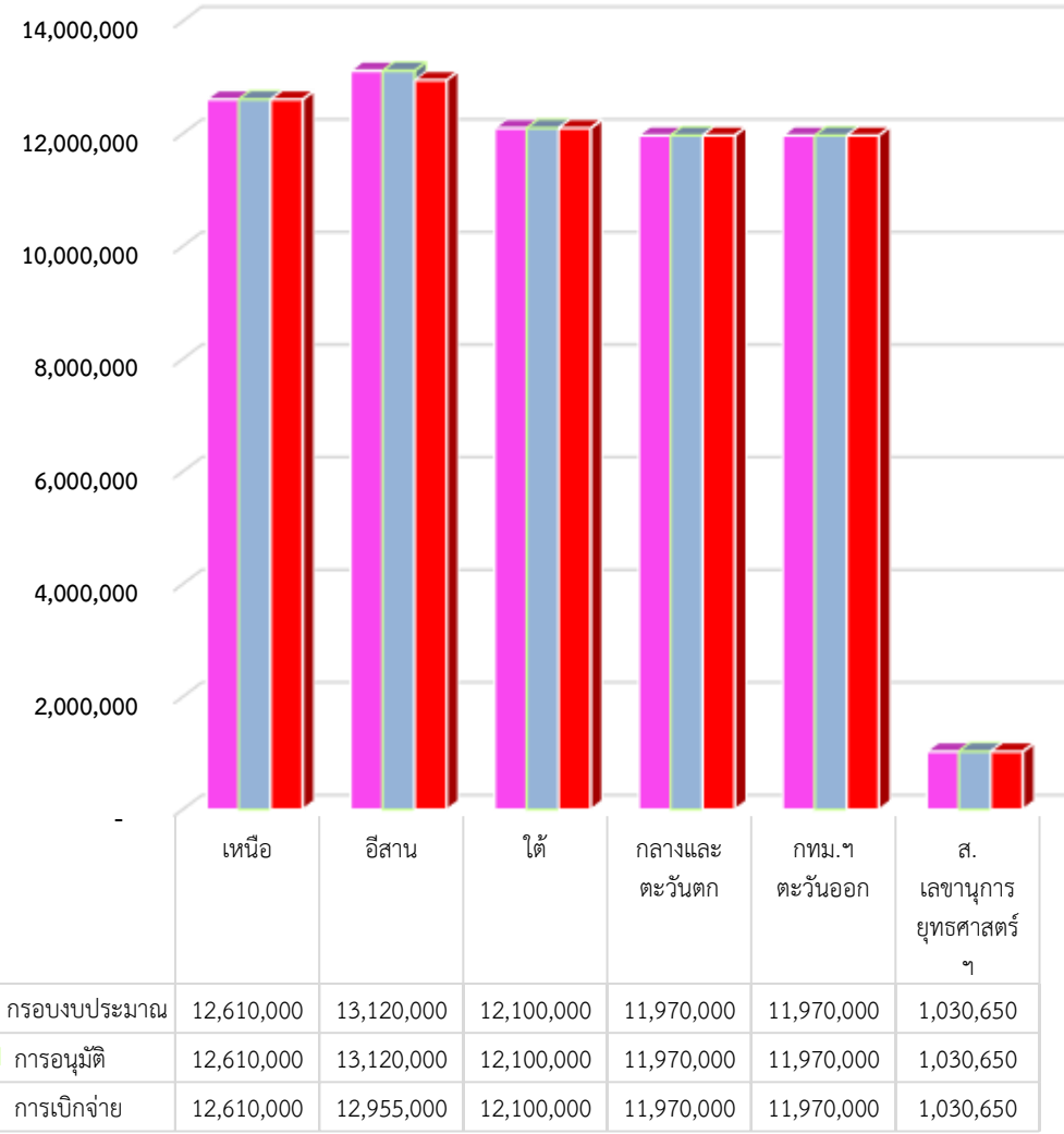
แผนภูมิเปรียบเทียบกรอบงบประมาณ การอนุมัติ และเบิกจ่ายงบประมาณโครงการพัฒนาเชื่อมโยงกลุ่มธุรกิจชุมชน ปี 2563 ประจำเดือน ม.ค. 2564

จึงขอให้ สนง.ตะวันออกเฉียงเหนือ ตรวจสอบข้อมูลโครงการและงบประมาณที่ไม่สามารถดำเนินการหรือเบิกจ่ายงบประมาณได้ และให้ดำเนินการขออนุมัติยกเลิกโครงการและคืนงบประมาณให้ถูกต้องเรียบร้อยภายในวันที่ 10 กุมภาพันธ์ พร้อมทั้งจัดส่งบันทึกที่ได้รับอนุมัติให้กับสำนักยุทธศาสตร์นโยบายและแผน เพื่อเป็นข้อมูลในการจัดทำรายงานปิดโครงการและรายงานผลต่อ สตง.