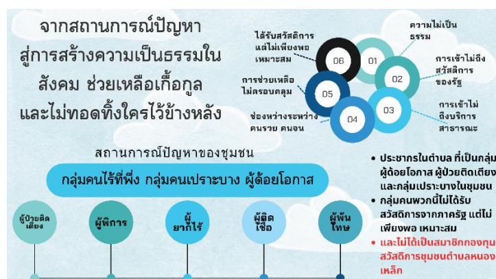
ภาพ : การช่วยเหลือสมาชิกกองทุน และกลุ่มเปราะบางในชุมชน

กลุ่ม องค์กร เครือข่าย กองทุนสวัสดิการชุมชนตำบลหนองเหล็กในการสร้างเครือข่ายกับหน่วยงาน กลุ่ม องค์กร ทั้งภาครัฐและภาคเอกชนในการ การสนับสนุนกิจกรรมของกองทุน หรือเป็นช่องทางในการประชาสัมพันธ์และระดมทุน การสร้างเครือข่ายกับกองทุนสวัสดิการชุมชนอื่น ๆ ในพื้นที่ใกล้เคียง หรือเครือข่ายองค์กรพัฒนาเอกชน (NGOs) ที่ทำงานด้านสวัสดิการสังคม สามารถช่วยแลกเปลี่ยนเรียนรู้ ประสบการณ์ และทรัพยากร เพื่อให้กองทุนมีการพัฒนาอย่างต่อเนื่อง