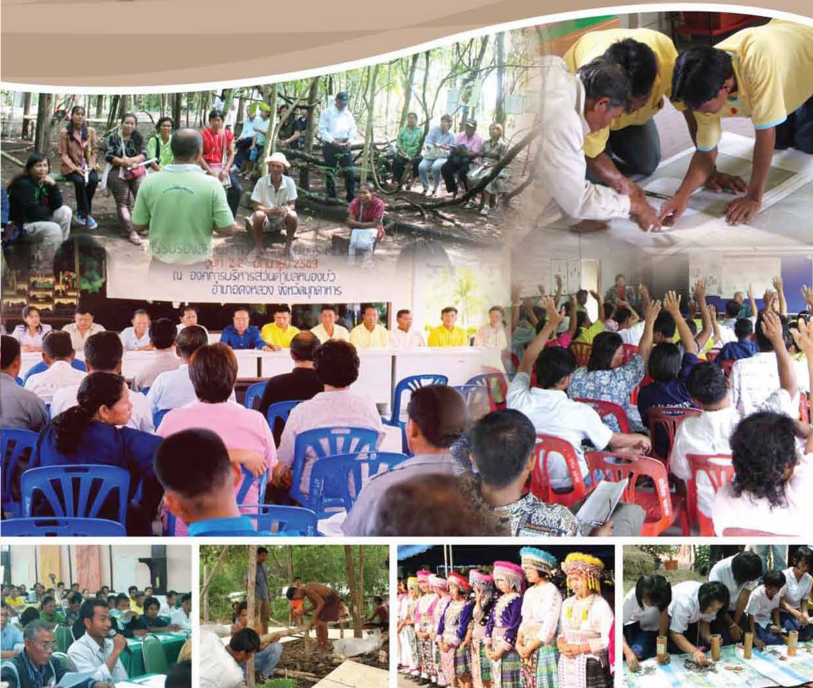
ประชุมเพื่อจัดทำแผนพัฒนาตำบล วันที่ 22 - 23 กรกฎาคม 2563 ณ องค์การบริหารส่วนตำบลหนองบัว อำเภอคลองหลวง จังหวัดนฤธาหาร