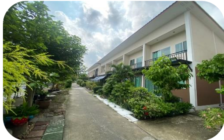
ชุมชนสามัคคีร่วมใจ