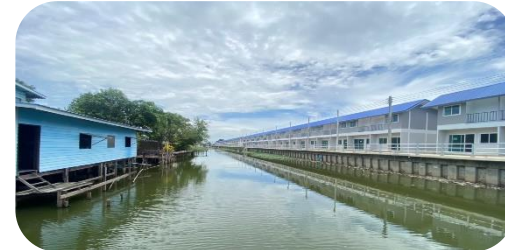
สหกรณ์เคหสถานบ้านมั่นคงชุมชนวัดรังสิต จำกัด