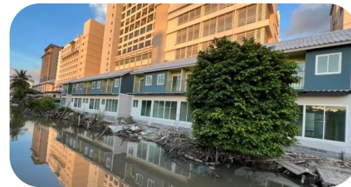
สหกรณ์เคหสถานตลาดหลักสี่ จำกัด