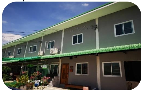
ชุมชนวังหิน

มีพื้นที่สามารถดำเนินการได้ 35 ชุมชน (41 โครงการ) 3,553 ครัวเรือน