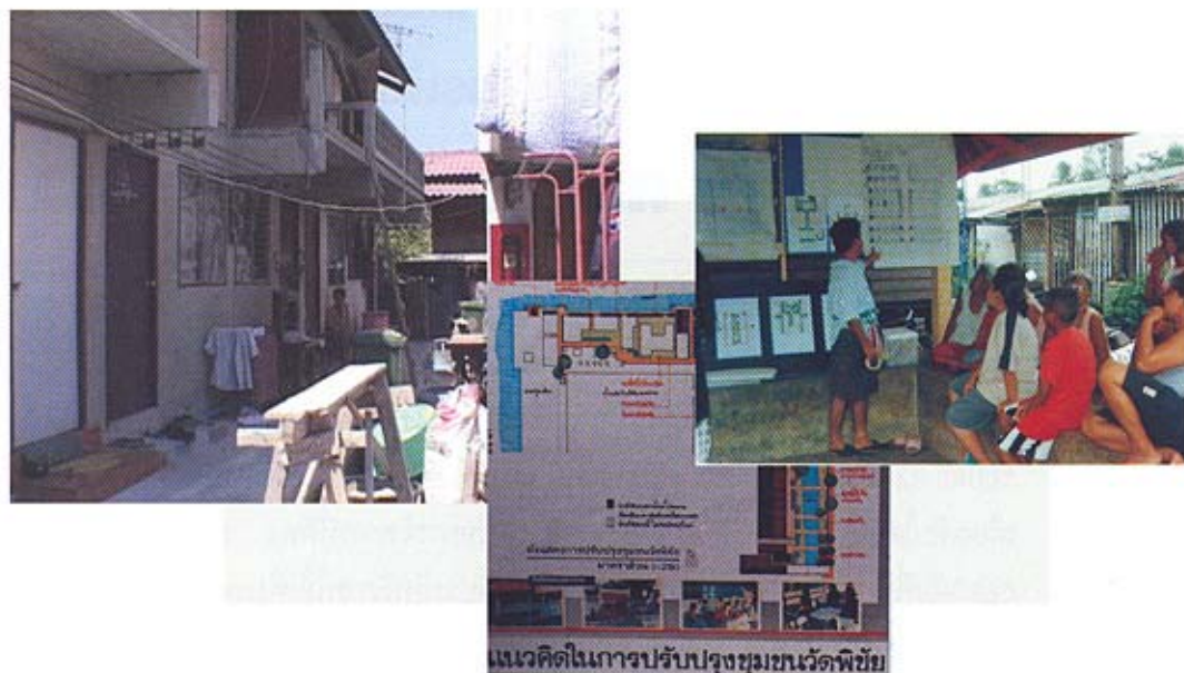
แนวคิดในการปรับปรุงชุมชนแออัด