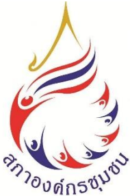
สภาองค์กรชุมชน