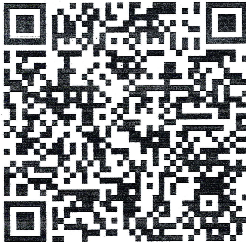
รูปที่ 2 QR Code ใบสมัครเข้าร่วมโครงการ