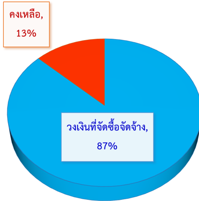
ภาพที่ 2 : แผนภูมิแสดงร้อยละของจำนวนงบประมาณที่จัดซื้อจัดจ้างจำแนกตามวิธีการจัดซื้อจัดจ้าง ประจำปีงบประมาณ พ.ศ.2563