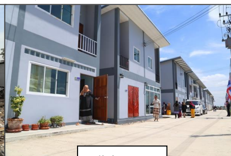
หลังดำเนินงาน