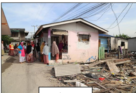
ก่อนดำเนินงาน

การพัฒนาที่อยู่อาศัยตามโครงการ “ปทุมธานีโมเดล” ดำเนินการใน 2 ชุมชน ได้แก่ ชุมชนแก้วนิมิตร (อยู่ห่างจากชุมชนเดิมประมาณ 2 กิโลเมตร) ก่อสร้างเสร็จแล้ว จำนวน 98 หลัง 100 ครั้วเรือน ใช้ชื่อโครงการว่า “บ้านประชารัฐไทยมุสลิมสามัคคี” และมีพิธีมอบบ้านเมื่อปลายเดือนกันยายนที่ผ่านมา รูปแบบเป็นบ้านแฝดขนาด 2 ชั้น ขนาดตั้งแต่ 56-77 ตารางเมตร ราคาก่อสร้างต่อหลังประมาณ 272,000 -295,000 บาท โดย พอช. สนับสนุนงบประมาณสาธารณูปโภค 5 ล้านบาท งบอุดหนุนที่อยู่อาศัย 2.5 ล้านบาท สินเชื่อที่อยู่อาศัยรวม 32.4 ล้านบาท ระยะเวลาผ่อนส่ง 15 ปี อัตราผ่อนส่งเดือนละ 2,500 - 3,000 บาท